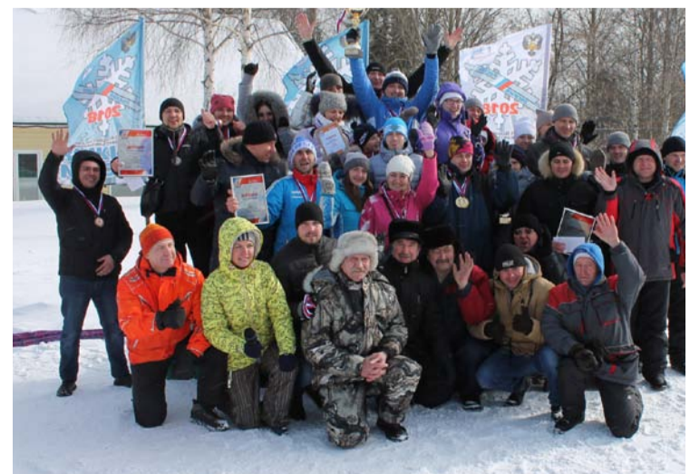
Участники и призеры спортивного праздника

В общекомандном зачете первую ступень пьедестала почета Зимней Спартакиады-2018 заняла команда шахты «Первомайская». Открытием этого сезона стала команда ПТУ, завоевавшая «серебро». «Бронза» спортивных батальонов угольщиков – у горняков ш. «Березовская». Все юные участники соревнований получили подарки. Командам-победителям вручили памятные кубки и дипломы, а также почетные грамоты компании и денежные премии. ▲