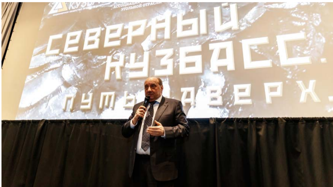
Премьера документального фильма «Северный Кузбасс» Путь наверх», г. Москва

Летом минувшего года съемочная группа из Санкт-Петербурга работала в Кузбассе над фильмом о простых, но особенных людях, на чьих плечах держится угольная промышленность страны. Почему документальная лента получила название «Северный Кузбасс» Путь наверх», каким был съемочный процесс и как оценили фильм первые зрители, мы узнали на презентации ленты в московском Центре документального кино.